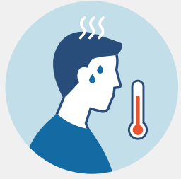
Koorts boven 37,3°C